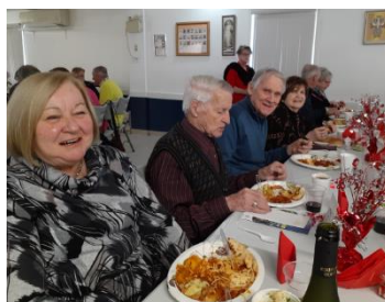
Abondance de mets et de sourires – St- Valentin à Portneuf