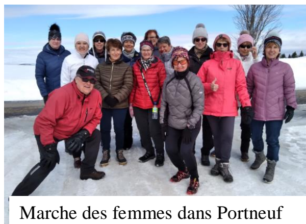
Marche des femmes dans Portneuf

Portneuf a maintenu sa 1 re position au régional.