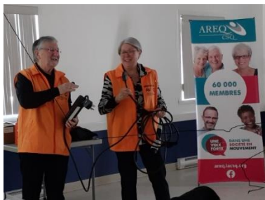
Les autos électriques, ça nous intéresse ?

POUR CETTE PAGE DE PHOTOS, CONSULTEZ LE FLAMBEAU VOLUME 19, FÉVRIER 2023, PAGE 18