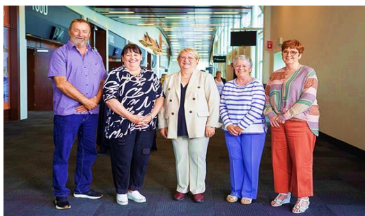
Délégués de Portneuf 03-K, au 48 e Congrès de l'AREQ à Lévis Centre des Congrès.