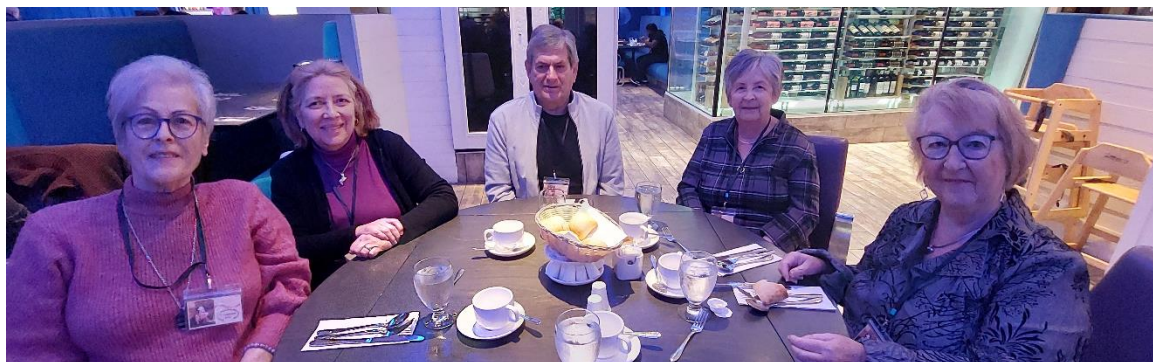
Photo des participants de l'AREQ Portneuf, à la journée internationale des hommes, à l'hôtel Québec, vendredi 17-11-2023.